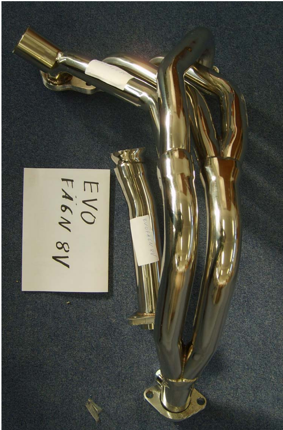
Auspuffkrümmer, Typ EVOFÄ6N8V